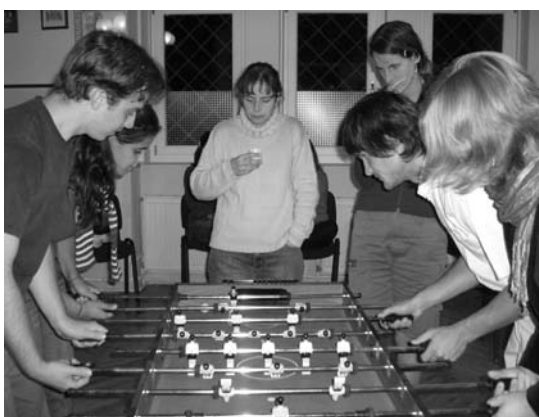
Csocsózás a pincében

Az évek során több megoldást is találtunk a ministráns verseny meghirdetésére, pontozására. Az utóbbi években rövidebb szakaszokra osztjuk a tanévet, így több lehetőség van „javítani”. Amikor elkezdtem ministrálni, nagyon sokan voltak, kicsik és nagyok egyaránt. Három korosztályban volt a verseny, és nagyon megdolgoztunk az első helyekért. Igaz, akkor még több mise volt, és a hétköznap reggeli misék sok (3) pontot értek. A reggel 6 órai, a ½7-es, illetve a 7 órai miséken még részt tudtunk venni úgy, hogy nem késtünk el az iskolából. Ma már ez az egyetlen fél 8-sal nagyon nehezen megoldható.