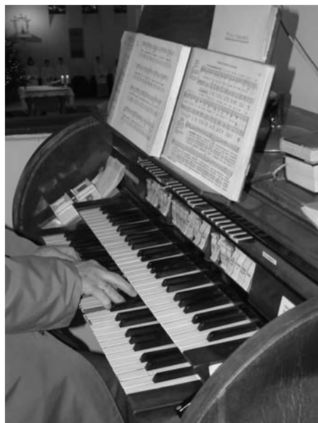
Énekeljünk az Úrnak

Legyünk mindannyian résztvevői és részesei a mindenség Istent dicsőítő, a megváltásért hálát adó kórusának!