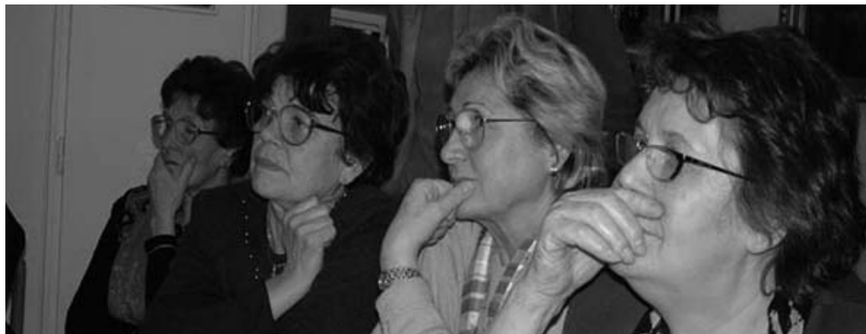
Munkában a képviselőtestület