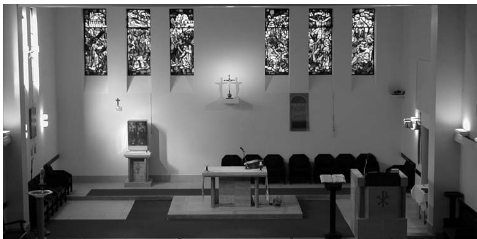
A megújult szentély

Az első átalakítással „helyére került” a szentély, immár a liturgiának megfelelő pozícióban van az oltár, a tabernákulum, a szószék és a papi szék is. Rendezett helyük van a ministránsoknak, a schola is méltó helyen vehet részt a liturgiában.