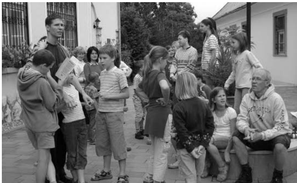
Közösségi életünket a nyári programok színesítik

A zsolozsma imádkozása is újra rendszeressé vált: adventben és nagyböjtben szombat esténként vesperást, a nagyhéten lamentációt énekelünk. A gyerekkórus vasárnap reggeli próbája laudessel kezdődik, a tábori gyakorlat alapján pedig mindenki ismeri és éneklí a kompletóriumot.