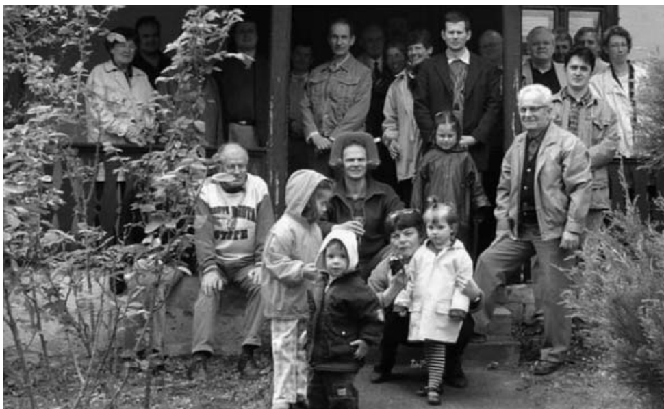
Nagymaroson ülésezett a testület