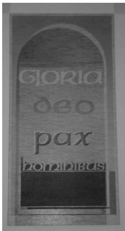
A papi helyét kiemelő kárpit

Kő gyertyatartóban végső és állandó elhelyezést nyert a déli falpillér előtt a húsvéti gyertya. A karzat falára került két darab, három-három zászlót befogadó tartó, a szószék elejére vörösréz bibliatartó, mechanikus vetítő-emelő, és két újságtartó-persely az oldalbejáratokhoz. Kiegészült a mise kezdetét jelző csengősor is.