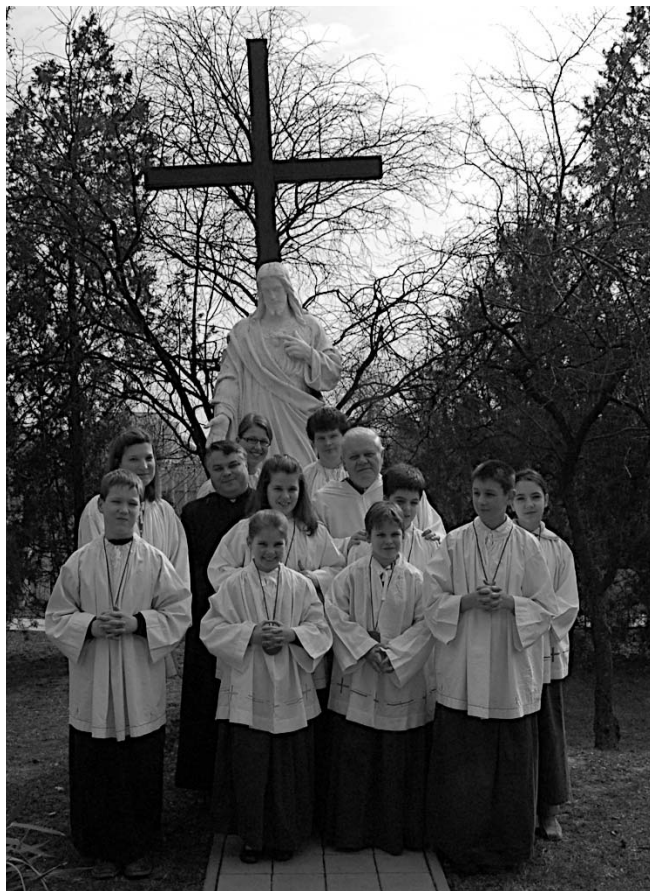
Az idén avatottak az atyákkal és dékánjaikkal

A ministráns vezetőknél fél évente megrendezésre kerülő fórumának 2009. november 21-én plébániánk volt a házigazdája. Erről összefoglaló cikk jelent meg a Felsőkrisztina 2009. adventi számában.