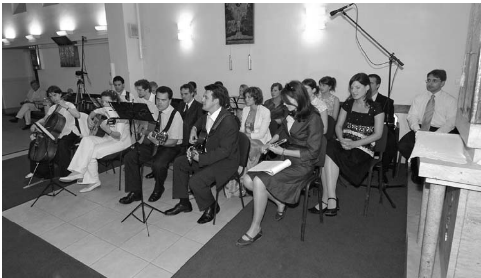
Húsz év óta muzsikálnak együtt

Az együttes a jövőben is szeretné a gitáros miséket gazdagítani, új dalokat tanulni, és egyre inkább bekapcsolódnai az egyházközség életébe, valamint továbbra is megőrizni az eredetileg kitűzött célt: „Dicsérjétek Őt csengő muzsikával!”