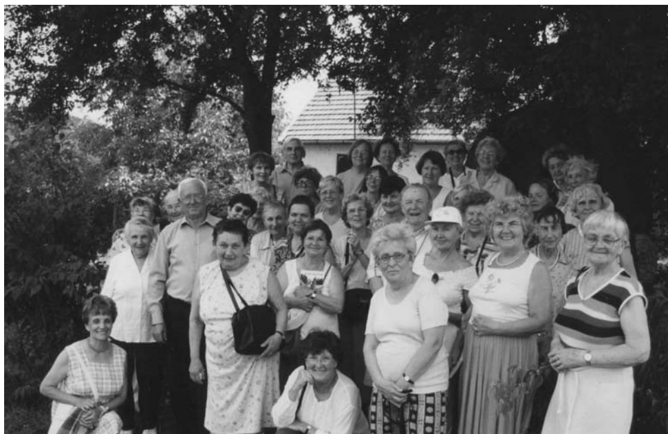
Rendszeresen kirándulnak az Apor Vilmos Idősek Klubja tagjai

A gazdasági válság okozta nehézségeket enyhítendő és a magyar gazdákat segítő 2009-ben a nagycsaládosok részére „gyümölcs vásár” akciókat szerveztünk. Nagy sikere volt a sárgabaracknak, a ribizlinek és az almának is.