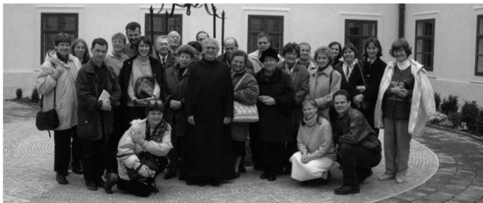
Képviselőtestületi lelkigyakorlat Tihanyban

Mint minden közösségben, úgy a képviselőtestületben is lényeges, hogy tagjai minél jobban megismerjék egymást. E célt szolgálták a képviselőtestületi lelkigyakorlatok, amelyekre időről időre más közösségek tagjai is eljöttek, valamint az ún. „kihelezett ülések” Nagymaroson és Dobán, ahol kötetlenebb formában beszélgettünk az egyházközség és saját életünk dolgairól.