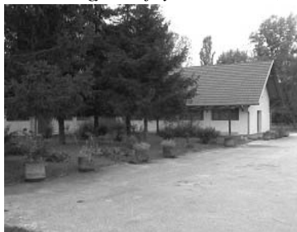
A tábor bejárata

Kicsik is, nagyok is (folyt. az 1. oldalról)