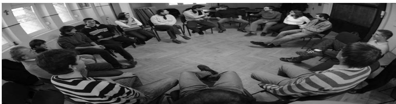
Ministráns fórum plébániánkon (cikkünk a 2. oldalon)