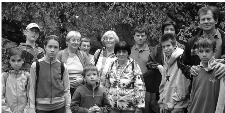
Vendégségben a máriahalmi plébánián

Vértes nyúlványain, szép hajlású dombok között éri el kocsikaravánunk az első állomást, Epölt, ahol népes csapat fogad bennünket. A képviselőtestület tagjai, hittanosok, egész családok várnak, és ebben a közvetlen, szeretetteljes fogadtatásban megérezhető közösségük ereje: hitük szoros tartozéka, hogy felelősnek érzik magukat egymásért, pap-