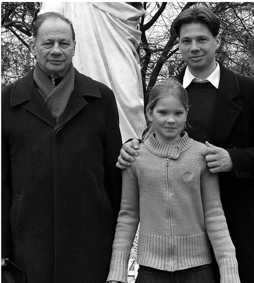
Plébániánk egyik ministráns dímasztiája