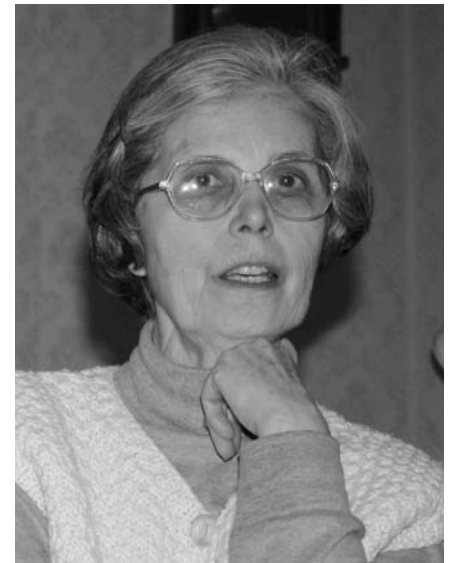
Várjuk az új tagok jelentkezését

Az évek során folyamatosan csatlakozott a tagság, ezért új személyek bevonásáról kellett gondoskodni. A tíz év alatt 45 tagunk volt. Nyolcan