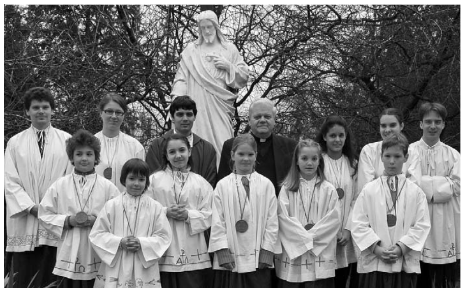
Ministráns avatás, március 29.