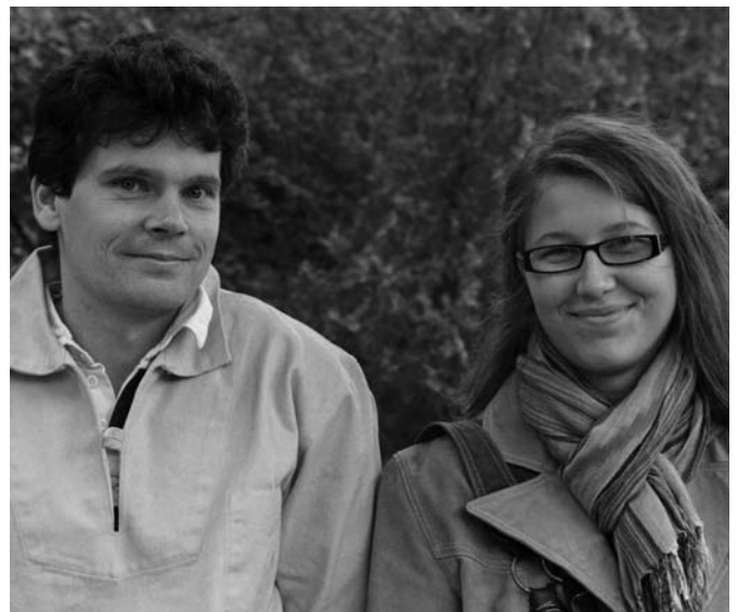
Az új dékánok