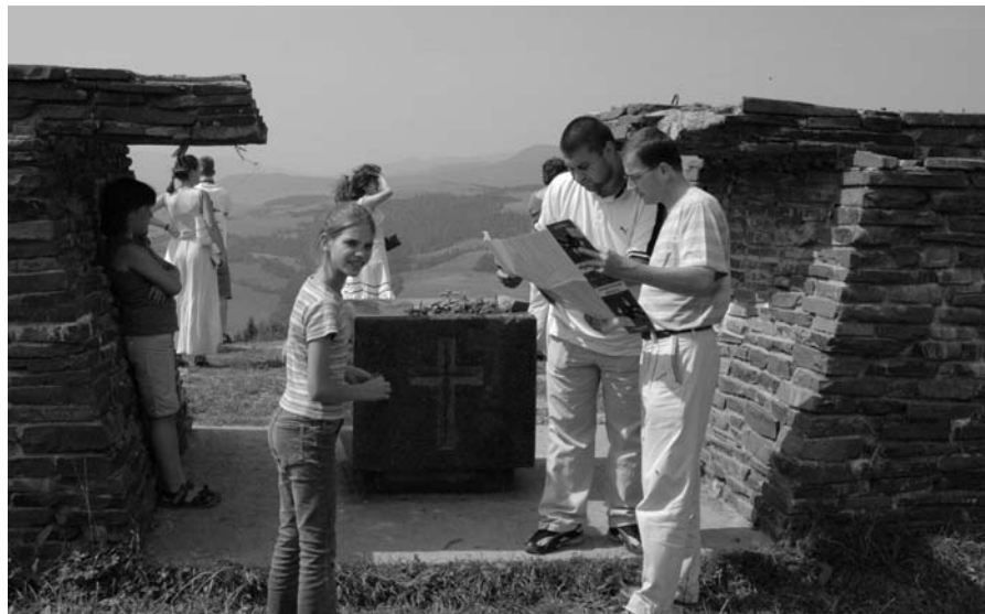
Verecke híres útján jártunk