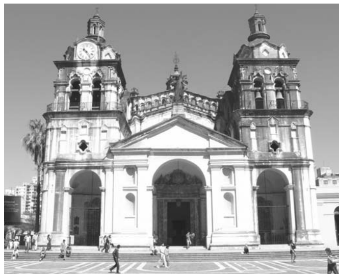
A córdobai székesegyház