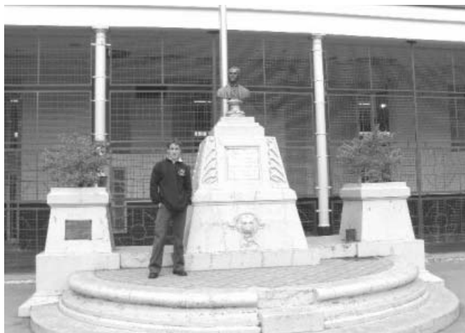
Egyenrubában a szalézi gimnázium udvarán

Sikeres egyetemi felvételim után, miután évhalsztást kértem a Pázmány Péter Katolikus Egyetem jogi karán, 2005. augusztus 5-én indult repülőgépem a 12 ezer km távolságban lévő, észak-argentínai Tucumán tartomány fővárosába, San Miguel de Tucumánba, ami 700 ezer lakosú, nagy múltú város, 1300 km-re az argentin fővárostól, Buenos Aiestől. A várost 450 éve alapították a spanyol konkvisztádorok, a XVIII. században, a la platai alkirályság fővárosa is volt, majd 1812-ben itt zajlott a híres tucumáni csata, amelynek során Belgrano tábornok – az argentin szabadságharc egyik fő alakja – súlyos vereséget mért a királpárti spanyol seregekre. Négy év múlva Tucumánban nyilvánították ki Argentína függetlenségét. Az ország történelmében tehát meghatározó ez a város, amely egy éven át otthonom volt.