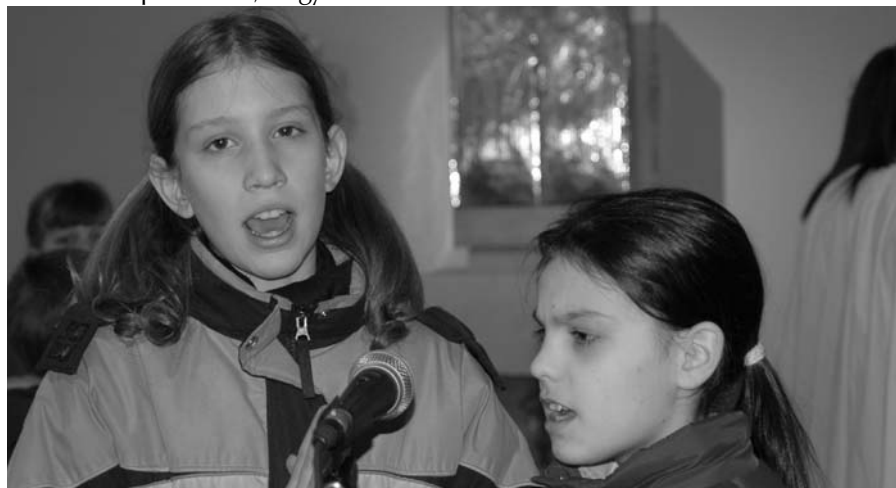
Schola új generáció