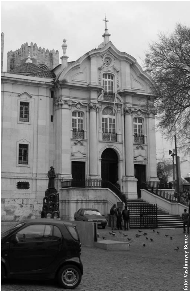
Páduai Szt. Antal szülőházára épült templom

Képek a 2005. évi városmisszió színhelyéről, Lisszabonból