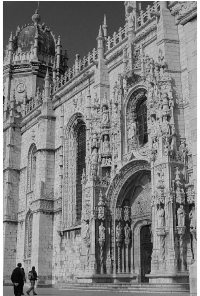
A konferenciaelőadások helyszíne, a Jeronimos-kolostor