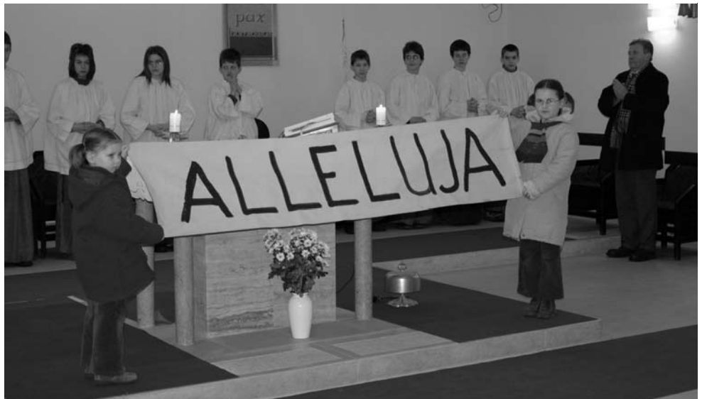
A nagyböjtre elbúcsúztunk az Allelujától

A 2005-ös esztendő legfontosabb lelki eseménye plébániánk négynapos, városi missziója volt. Meg akartuk erősíteni híveinket hitükben és megszólítani az érdeklődő, távollévő embertársainkat. Megköszönjük az előkészítők, a közreműködők munkáját. Tevékenységünk hatását – természetesen – nem tudjuk rögtön felmérni, tapasztalni, de jele annak, hogy érdekel, foglalkoztat bennünket az Egyház, plébániánk jelené és jövője. Megjegyezzük, hogy 2007-ben az egész fővárosra kiterjedő katolikus misszió lesz. Ennek előkészülete már folyamatban is van.