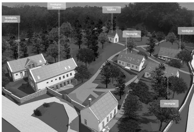
Az óbudavári Schönstatt falu látványterve