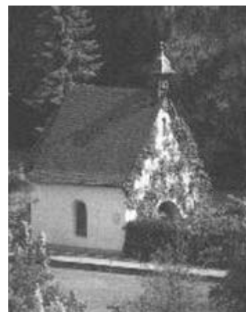
Mária schönstatti szentélye