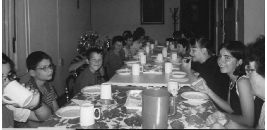
A tavalyi napközis tábor meghitt pillanata

„Egyengessétek az Úr útját” (Keresztelő Szent János)