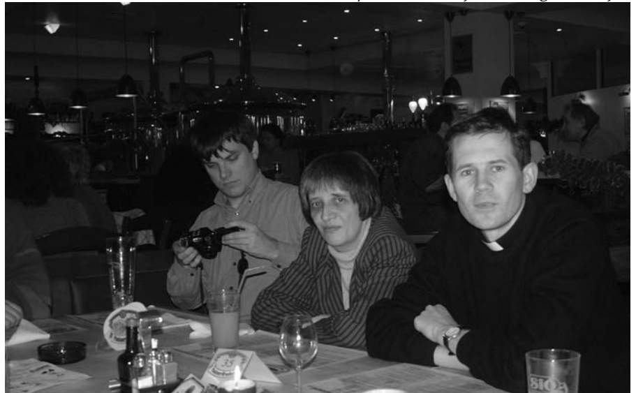
Munkában a sajtóbizottság

Felvetődött egy előadássorozat (továbbképzés, tanfolyam?) lehetősége, amelyben szakemberek segítenék a plébániai fiatalságot eligazodni a média világában. Az idősebbeket esetleg egy keddi esti előadáson lehetne a katolikus sajtó helyzetéről és jelentőségéről tájé-