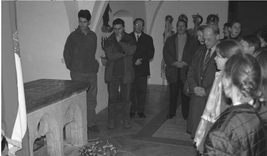
Elhelyeztük koszorúnkát Boldog Gizella sírjánál, Passauban

határon még arra sem méltatott minket az osztrák határórség, hogy megnézze útlevelünket, így a tervezettnél jóval hamarabb Ausztriában folytattuk utunkat. Megkerültük Bécsset, a Bécsi-erdőben elhaladtunk Heiligenkreuz cisztercita apátsága, majd a történelemből ismert Mayerling mellett. Az A 1-es autópályáról jól láttuk Melk bencés apátságát és a schallaburgi várat. Alig múlt el 1/2 2, mikor Passaub a értünk. A kellemesen langyos időben rövid sétát tettünk a három folyó városában. Megcsodáltuk a híres barokk dómot, ahol a világ legnagyobb templomi orgonája található. Innen az ősi Niedernburgi Kolostorhoz vezetett utunk, aminek templomában nyugszik első királynénk, István király hit-