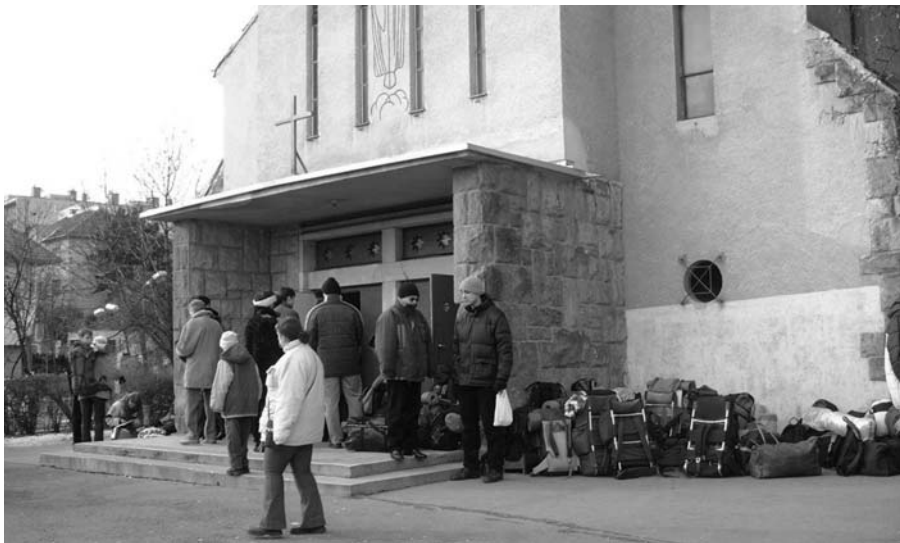
Taize-s fiatalok újév napján a templom előtt