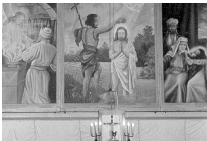
A felvétel 1956 húsvétján készült

Borgo megel Santo mát, 150.000 azok tási sz börög 45 bik 450 é a vilá tribür nöke tak h és az Szo