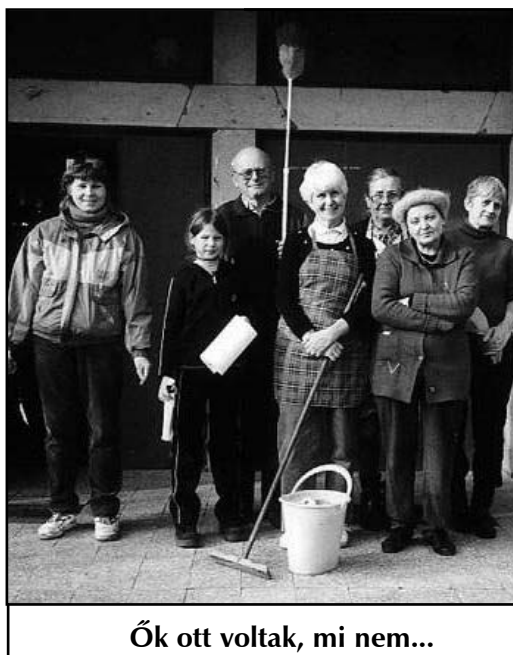
Ők ott voltak, mi nem...

Megköszönjük a Testvéreknek, hogy áldozatos lelkiülettel és tettekkel, nagylelkű adományaikkal is vállalták a Magyar Katolikus Egyház, az Esztergom-Budapesti Főegyházmegye, valamint a plébánia anyagi terheit.