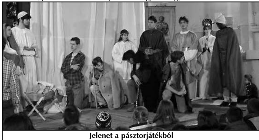
Jelenet a pásztorjátékból