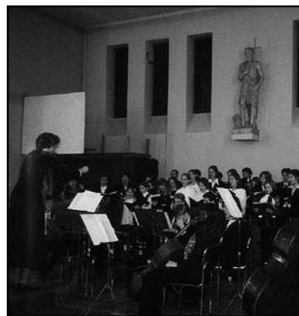
Sikere volt az idei koncertnek is

Nem ünneprontásnak szánom, de szólni kell néhány negatív jelenségről is. Az elmarasztalás természetesen nem annak a öt ministránsnak szól, akik a templomi betlehemet felállították. Nem is azoknak akik a címlapfotón láthatók (és még annak a három fiatalnak, akik e képről lemaradtak) és a templom takarítását végezték. De szól azoknak, akik nem voltak ott, bár minden lehetőségük meg lett volna, hogy ott legyenek.