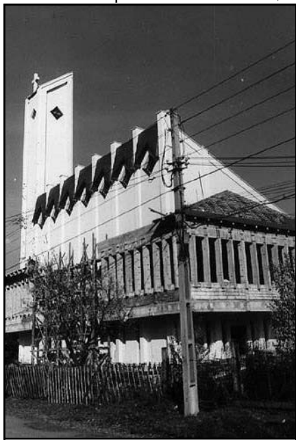
Az épülő templom Parajdon

Keresztelő Szent János templom 1800-ban készült el, de nagyon rossz állapotban van, a salétrom teljesen tönkretette. Ezért határozta el az egyházközség egy új templom építését, amelynek szintén Keresztelő Szent János lesz a védőszentje. E templom 8 éve épül, valószínűleg 2001-ben készül el. A harmadik templom a helyben lévő sóbányában, a föld mélyén található. Ezt három felekezet is használja, a katolikus, a református és az ortodox. Patrónusa Nepomuki Szent János, a