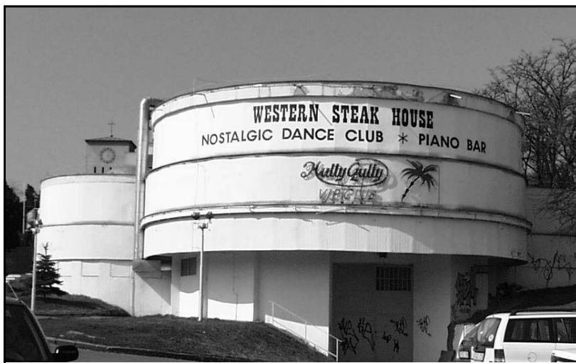
A nagyszombati körmenettel jelképesen is birtokba vettük