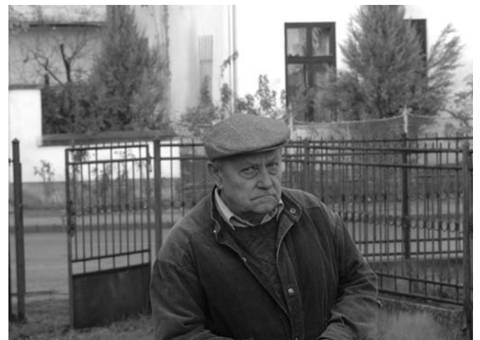
Az unokatestvér, aki igen hasonlít a professzor úrra