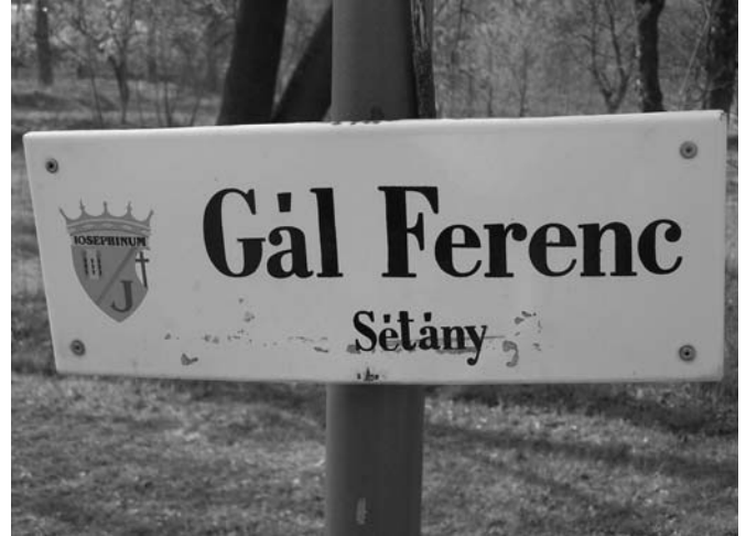
Az egyetem kertjében sétányt neveztek el róla

mel válaszoltam. Megírtam VI. Pálnak, hogy sokkal többet tehetek az egyházért és az országért azzal, hogy tanítom az ifjúságot, járom az országot, papoknak tartok továbbképzést, az Egyetemi templomban konferenciabeszédeket. A kommunista rezsim ugyanis együttműködést követelt. Hozzám is számtalanszor jöttek, a kedvemet keresték, de rossz helyen kopogtattak.” (Új Ember, 1998. aug. 9.)