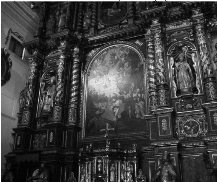
Közép-Európa legnagyobb faoltára

A korszak legnagyobb szabású magyarországi oltárát a bécsi asztalos, Baltasar Knilling és a nagyszombati szobrász, Veit Stadler közösen készítették 1637-1640 között. A mélybarna architektúra és az aranyozott szobrok és ornamentika színellentétére épített hatalmas oltár az egész templomteret lezárja, s rajta négy emelet magasságban,