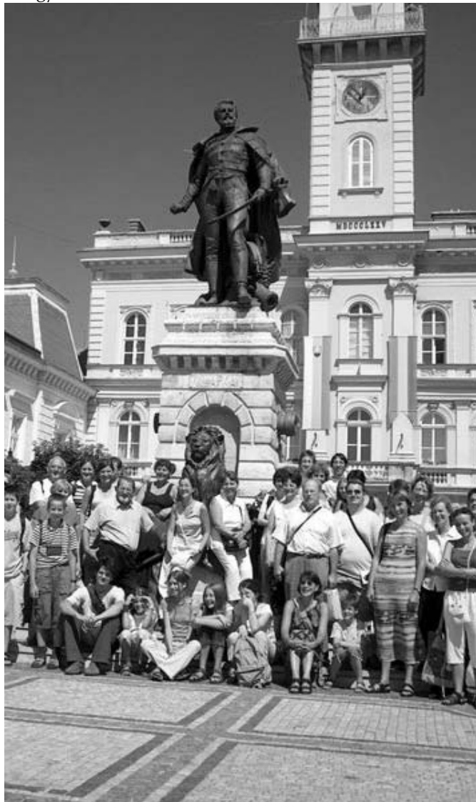
A klapka szobor tövében, még a nyári zarándoklalon

Scholánk a nyári, felvidéki zarándoklalon meghívást kapott a „Harmonia Sacra Danubia egyházzenei és egyházművészeti fesztivál” utolsó napi kórustalálkozó-jára Révkomáromba október 30-ra. Egyik ottani vendéglátónk igazította helyre a település neve körül bennünk élő tévedést: a települést a más Komáromoktól (pl. Homokkomáromtól) való megkülönböztetésül hívják Révkomáromnak, minthogy a dunai révnél fekszik, s melynek északi és déli részét csak 1920 óta választja el egymástól a trianoni határ.