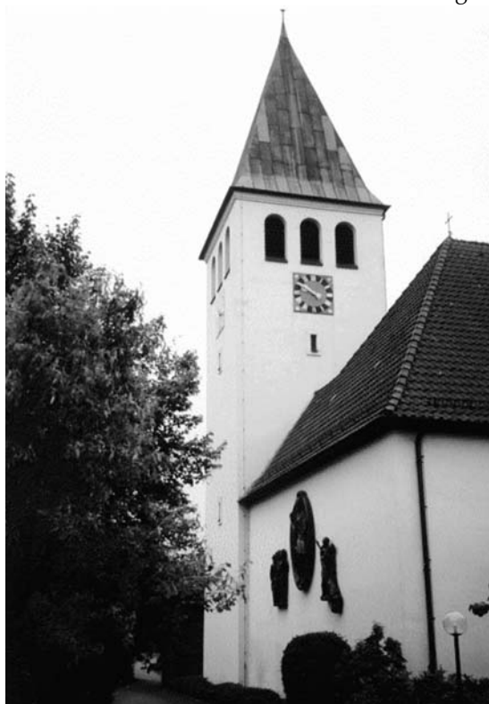
A bomtei Keresztelő Szent János templom

A Tamási Áron (Mártonhegyi) iskola 10 éven keresztül partneri kapcsolatot ápolt az alsó-szászországi Bohmte középiskolájával. Minden év tavaszán német gyerekeket láttunk vendégül, majd őszszel a magyar diákok látogattak tanáraik kíséretében Észak-Németországba. Sajnos, a cserekapcsolat egy évtized után megszűnt, de az évek során kialakult barátságok megmaradtak. Így jártam augusztus elején – immár másodszer – Bohmtében. Már első utam során örömmel láttam, hogy a kisváros katolikus temploma is Keresztelő Szent János oltalmában áll, de akkor – kísérő tanárként – a sűrű program miatt, nem tudtam időt szakítani arra, hogy megismerkedjek a katolikus közösséggel és templomával. Idén már magánemberként utaztam oda, ezért lehetőségem volt a plébános atyával beszélni és egy kicsit a templom történetét is kutatni.