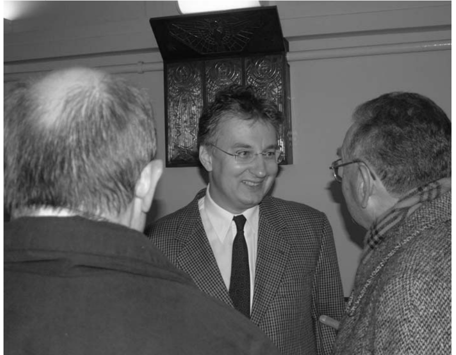
A Felsőkrisztina Katolikus Kör decemberi vendége

A zsinati előkészület következő lépéseként a bizottságok a javaslatok rendszerezése után javaslat-tervezetet készítenek, amelyet a hívekkel közösen fóru-