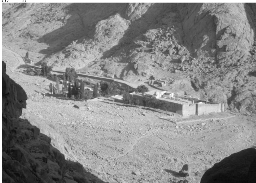
A Sínai-félszigeten, a Hóreb-hegy lábánál fekvő Katalin kolostor, melyben állítólag Alexandriai Szent Katalin földi maradványait őrzik