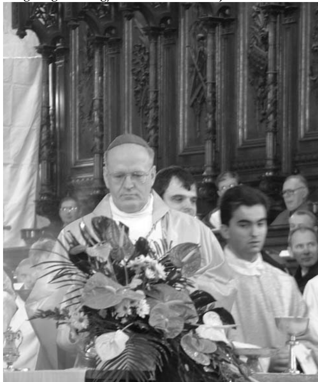
Erdő Péter, Magyarország új primása

Ezeket az emlékeket csak azért írom le, mert kimaradnak az életrajzodból, amit most sokféle lehet olvasni. Mint ahogy az is, hogy később, már amikor Esztergomba kerültél, hány plébánián és templomban teljesítetted „kiszegítő” szolgálatot, mert ugyebár mint tanár, „bőven” rendelkezted szabadidővel, már legalábbis időbeosztóid szerint. Azután telt az idő, én is családot alapítottam, s nagy örömünkre szolgált, hogy jelesebb családi eseményeinknél, kezdve az esküvőnkkel, folytatva a keresztelőkkel stb. mindig te voltál a „családi pap”, s bár professzorként röpködtél már óraadásról óraadásra Budapest, Róma és Németország között, mindig szakítottál ránk is időt, ha csak egy beszélgetés vagy problémamegbeszélés erejéig is.