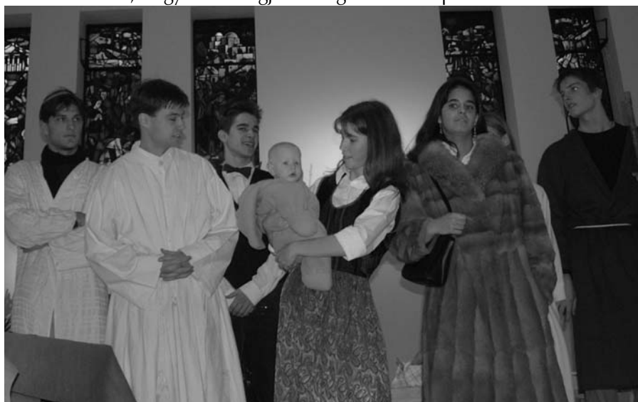
Karácsonyi betlehemes játék, élő Kiszéussal

Köszönetet mondunk a plébánia papságának, a plébános és a