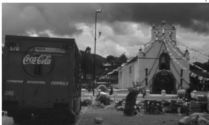
Amerika, ahogy én láttam: templom és Coke