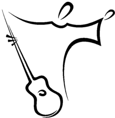
Felső-Krisztinavárosi Gitáros Együttes 1990-2002

Hirdetjük a kedves testvéreknek, hogy a nyári szünet előtti utolsó „gitáros” szentmise 2002. június 23-án , a nyári szünet után az első „gitáros” Szentmise 2002. szeptember 8-án lesz.