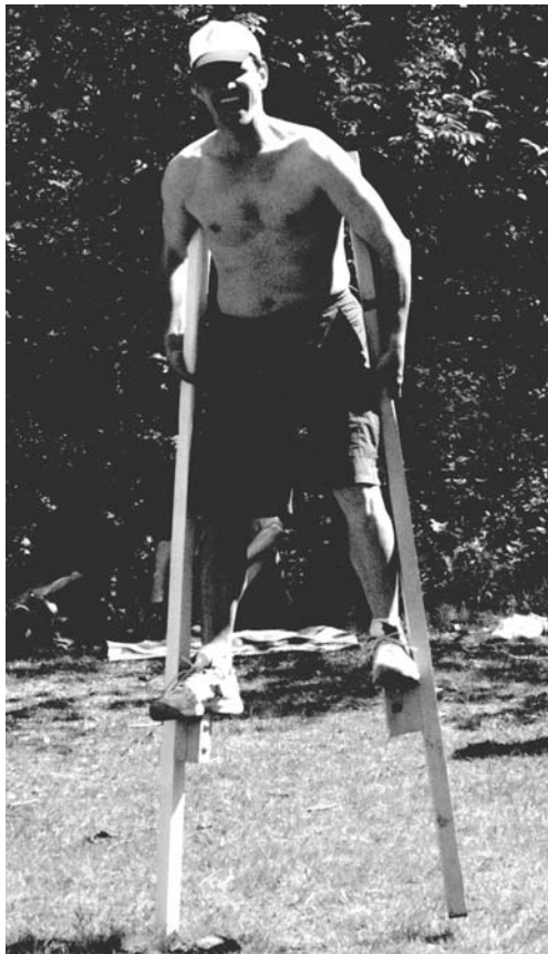
Idén is jól éreztük magunkat a majálison

Az előadást követően arról szó volt, hogy is kezdjük a felkészülést. A tervek szerint júniusban a „Felsőkrisztina” mellékleteként megjelentetünk egy tájékoztatót. Ebben ismertetjük a zsinat célját, az előkészület menetét, a munkacsoportokat, vezetőik nevét, elérhetőségüket. A tényleges előkészület a Mindszenty- zárandoklattal, majd a plébániai lelki gyakorlatlal indul. Ezt követően a munkacsoportokban folytatódik majd a munka, amelyet a zsinat két napja zár le. (folytatás a 3. oldalon)