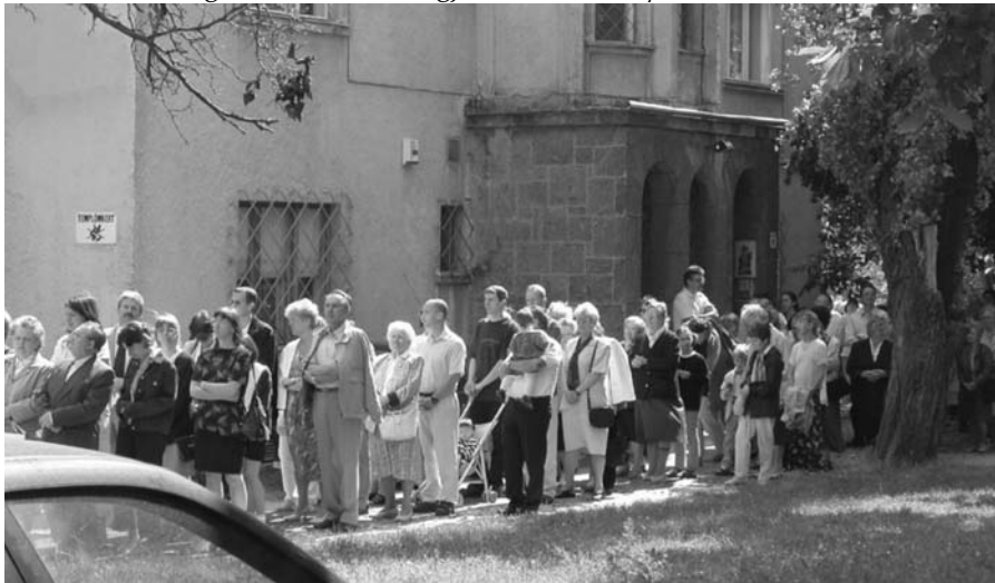
Úrnap körmenet 2002

„A plébánia elsősorban nem struktúra, terület vagy épület, hanem inkább Isten családja, testvériség, amelynek egy a lelke, családi testvéri befogadó ház, a hívők közössége” (Christifideles Laici) A plébániai közösség akkor él, ha tagjai