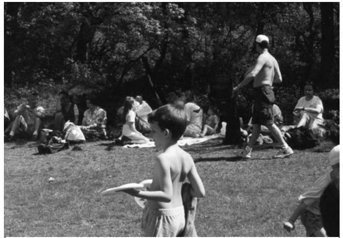
A majálison mindig süt a nap

1914 óta a mozgalom a világ több, mint 30 országában terjedt el. Mindenütt nemzeti (ún. leány-) szentélyek épültek, hogy ott is áradhasson a kegyelem. 1947-ben in-