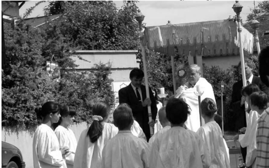
Úrnapi körmenet 2002

Kérjük tehát egyházközségünk minden tagját, hogy aktívan, elköte-