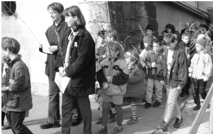
Virágvasárnapi körmenet a 9 órás gyerekmisén