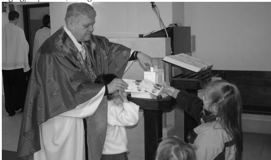
A legkisebbek is adtak dévai társaik javára