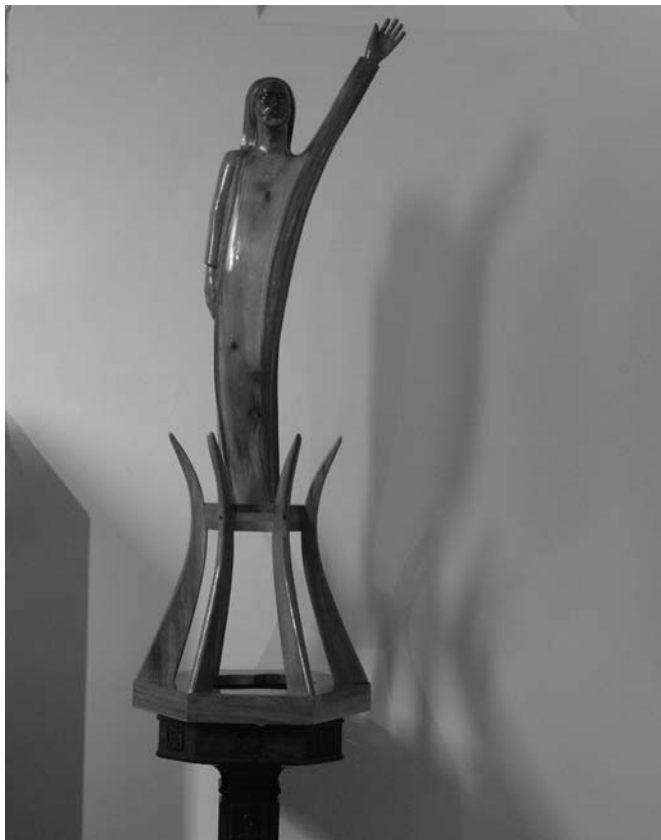
Az új Feltámadt Krisztus szobor