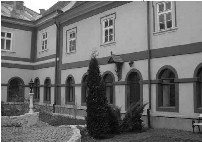
A dévai kolostor kerengője