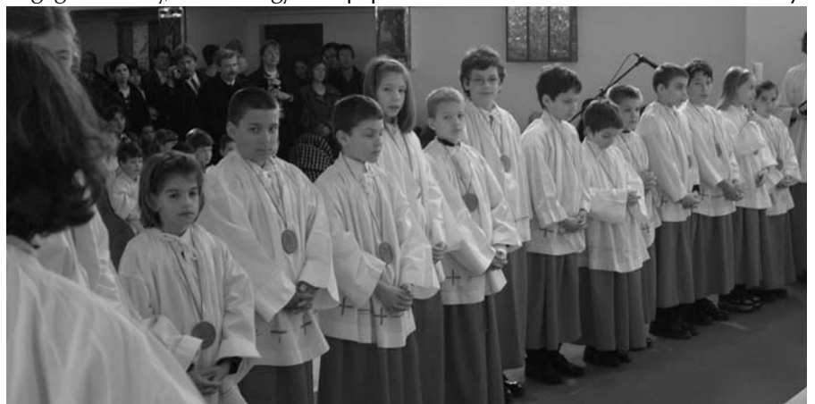
Nálunk is új ministránsokat avattak