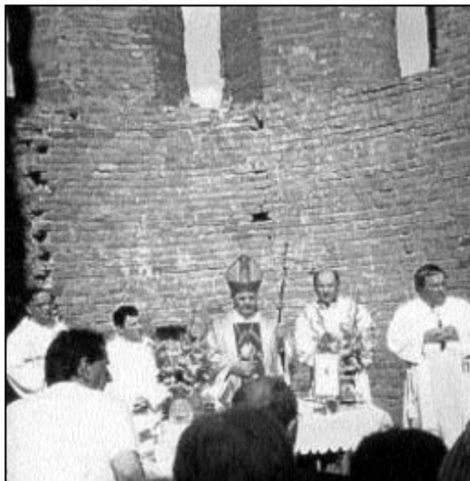
Szentmise az aracsi zárándoklaton