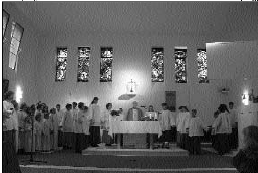
Veni Sancte megújult templomunkban