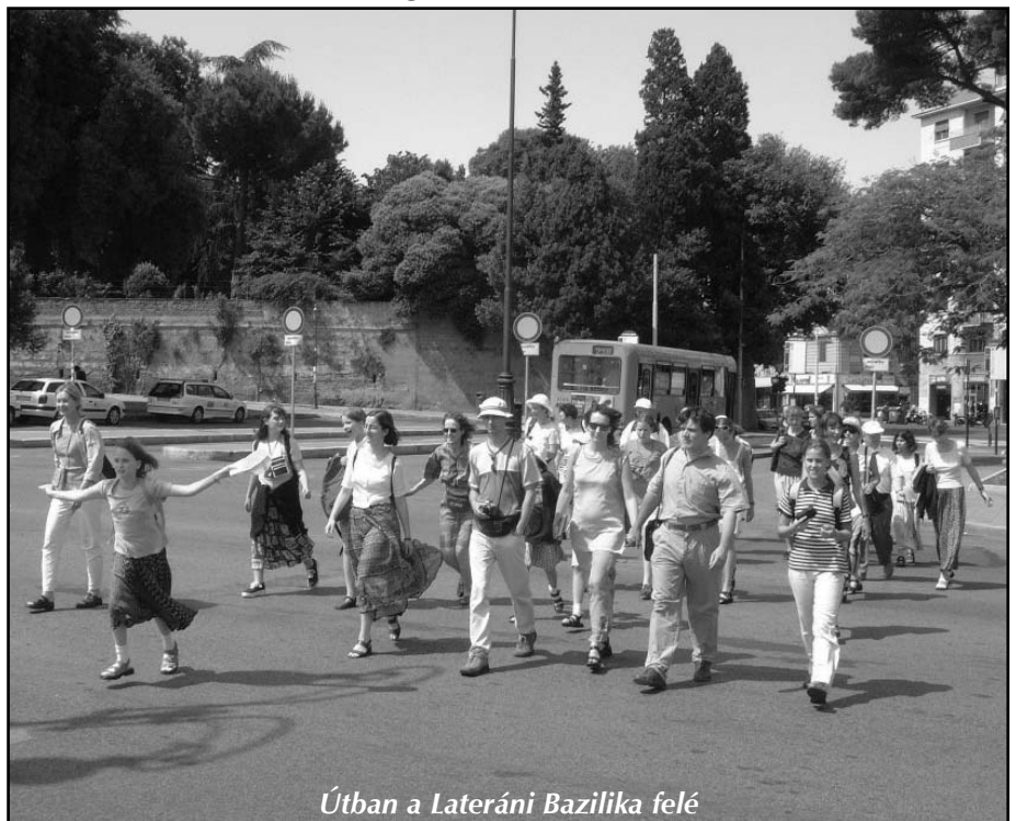
Útban a Lateráni Bazilika felé