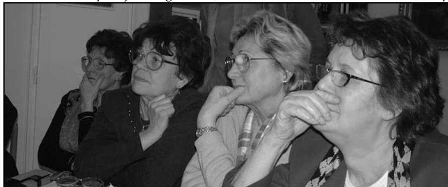
Képviselőtestületi tagok - munka közben