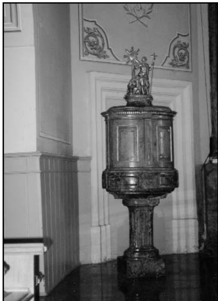
A füzesabonyi templom keresztelőkútja

Füzesabony sokunk számára ismert vasúti-közúti csomópont Budapeستől kb. 110 km-re keletre az M3-as autópálya mentén. Jelentőségét közlekedési helyzete adja: itt ágazik le a Budapest-Miskolc fővonalról az egri és a Tiszafüreden át Debrecenbe vezető vasútvonal. Az M3-as autópálya most itt ér véget. Aki lekanyarodik a gyorsforgalmi útról, hogy folytassa útját a 3-as főúton, már messziről látja barokk templomának sárga tornyát.