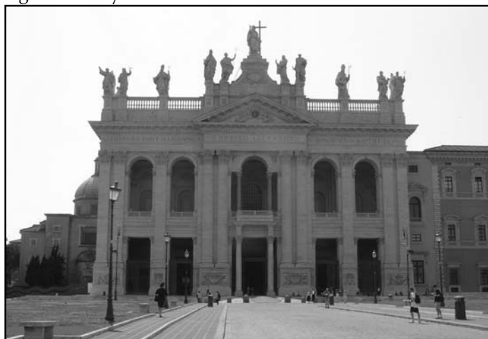
A Lateráni székesegyház minden templomok anyja és feje, valamint testvértemplomunk is