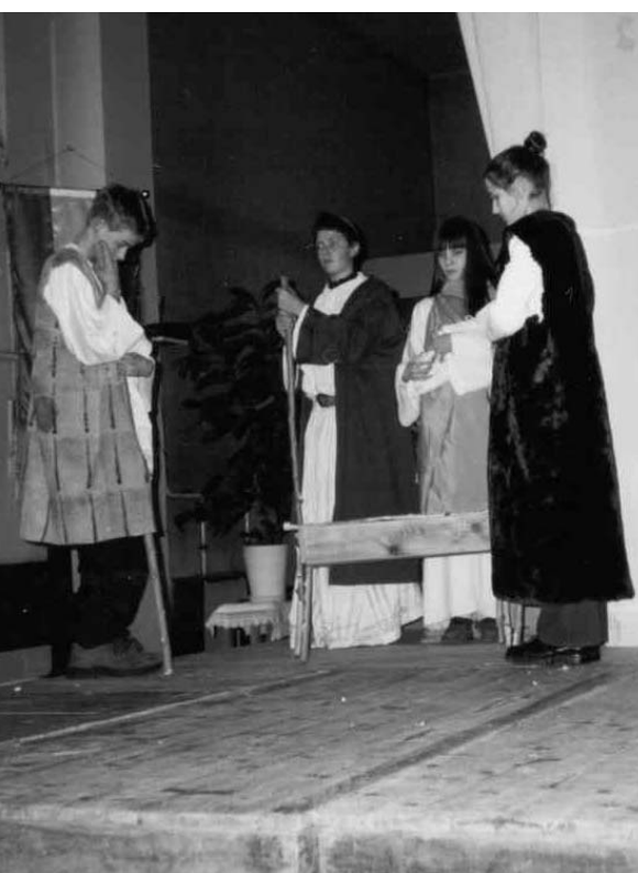
Részlet a 2000. évi pásztorjátékból

A 2000. évben 39 gyermeket kereszteltünk, 9-cel kevesebbet, mint tavaly. Kerületünknek kb. 64.000 lakosa van, és csak kb.350 gyerek születik évente. Bérmálás is volt plébániánkon. 11-es részesültek a