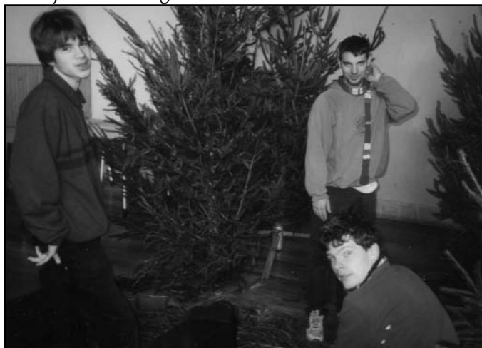
A Betlehem állító ministránsok