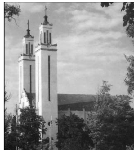
Meg nem épült templomunk építésének, Irsy Lászlónak megvalósult terve Pusztaszabolcson