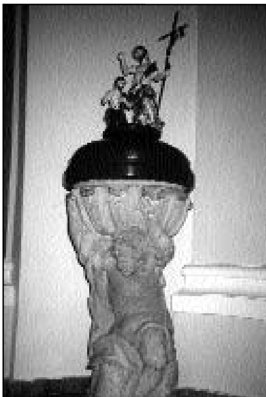
Keresztelőkút az epöli Keresztelő Szent Jánostemplomban