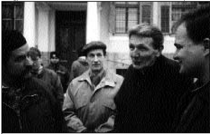
Pillanatkép a lelkigyakorlat egy szünetéről

Igyekeztünk megvalósítható tennivalókat kiokoskodni. Két legfontosabb területet látunk a közösségépítési munkában: