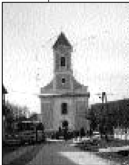
Az epöli Keresztelő Szent János templom

A március 25-én tartott első egyházközségi „Nyílt nap” jól sikerült. A plébánia életének számos kérdése szóba került, de nem minden. Előre láthatólag szeptember végén, vagy október elején folytatjuk. Akkor a fő téma, az új épület használatba vétele, hasznosításával kapcsolatos elképzelések lesznek.