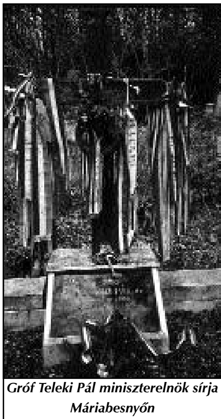
Gróf Teleki Pál miniszterelnök sírja Máriabesnyőn