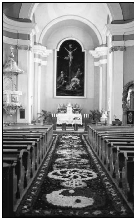
Virágszőnyeg visegrádi testvértemplomunkban

nyásztelepülés templománál már várt minket a falu fiatal plébánosa, aki a közös imádság után megismertetett bennünket a település és az egyházközség történetével és jelenével.