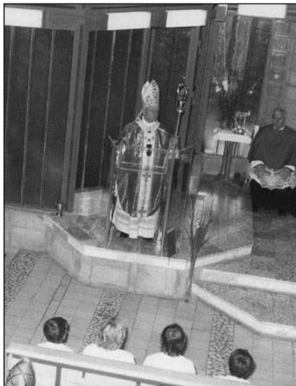
Lékai bíboros úr a Táltos utcában

szerűsítve, több szempontból is szakszerűtlenül készítették el, de mi ennek is, így is örültünk, mert sok évi bizonytalanság után végleges templomot vehettünk át, az annak működtetéséhez nélkülözhetetlen helyiségekkel együtt, s kezdhettük meg azok bensőségebbé, liturgikus szempontból elfogadhatóbbá tételét.