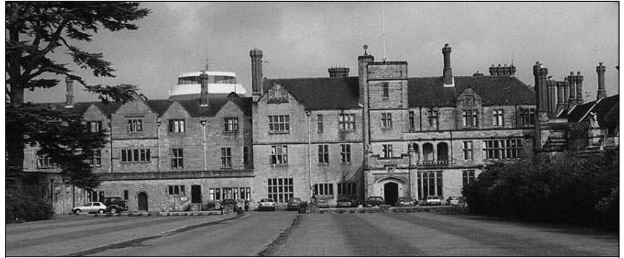
A Worth Abbey bencés apátság

„A Worth Abbey bencés apátság Dél-Angliában, London és Brighton között kb. félúton található. Egy gazdag család utolsó sarja a század harmincas éveiben hagyta a bencés rendre kastélyát, ahol a kolostort az első szerzetesek 1933-ban alapították. A bencés atyák eleinte a kastélyban laktak és a szentmiséket, valamint az imaórákat a kastély kis kápolnájában tartották, majd az évek során felépítették modern templomukat, kolostorukat, a kastélyt pedig középiskolává alakították át. Az építkezések még most is tartanak, az iskolakomplexum művészeti centrummal, tenisz- és golfpályával stb. egy-két éven belül készül el teljesen. A birtokon külön kolostorban apácák is élnek, magukat „Grace and Compassion” nővéreknek nevezik. Ma a kolostor történetének második apátja kb. 22-