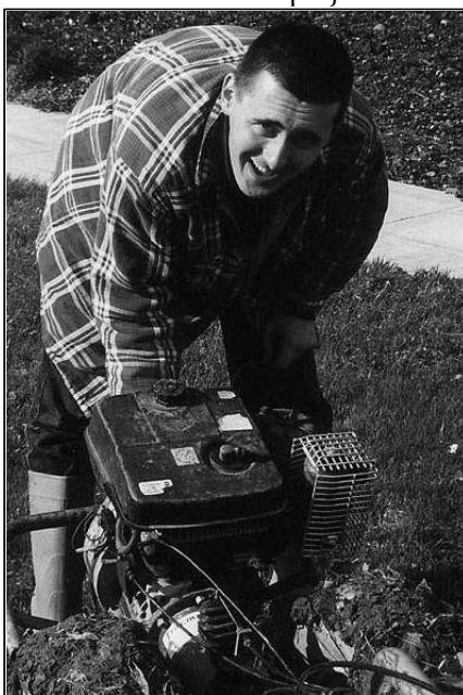
Mado munka közben

Egy év elteltével a bencés harmadrend tagjaként, lelkiekben és szellemiekben gyarapodva, tudatos katolikusként térhettem haza Magyarországra.”