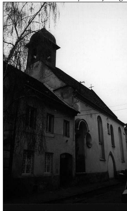
A brassói templom

Nagyon örülünk e két levélnek, reméljük, újakat is kapunk. Mindannyiunk számára tanulságos és elgondolkodtató, az évtizedekig tartó elnyomatás és ateista propaganda-hadjárat ellenére a székely magyarság kitartása hitében és magyarságában. A vallási élet olyan teljessége,