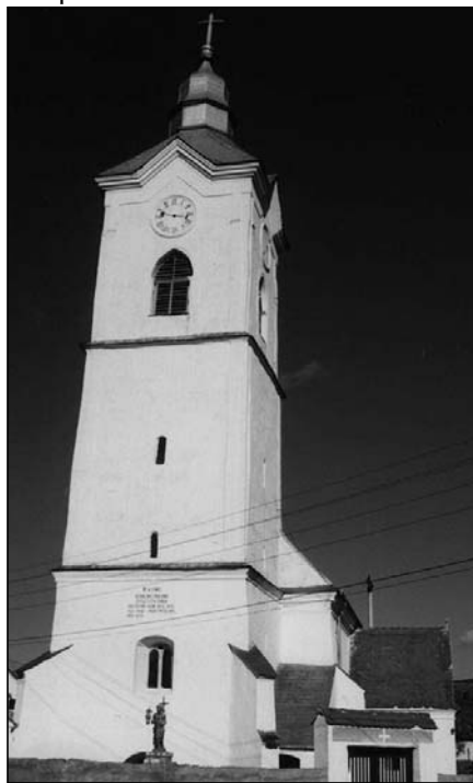
A gyergyótekerőpataki templom

Gyergyótekerőpatak majd 1500 lelkes falu Székelyföldön, a Gyergyói-medencében. Lakosságának 90 %-a magyar, 10 %-a cigány és 16 román nemzetiségű lakosa van. A község tiszta katolikus. A falut az 1567. évi adóösszeírásban említik először. A ma is álló középkori eredetű Keresztelő Szent János templomot 1724-ben kezdték el