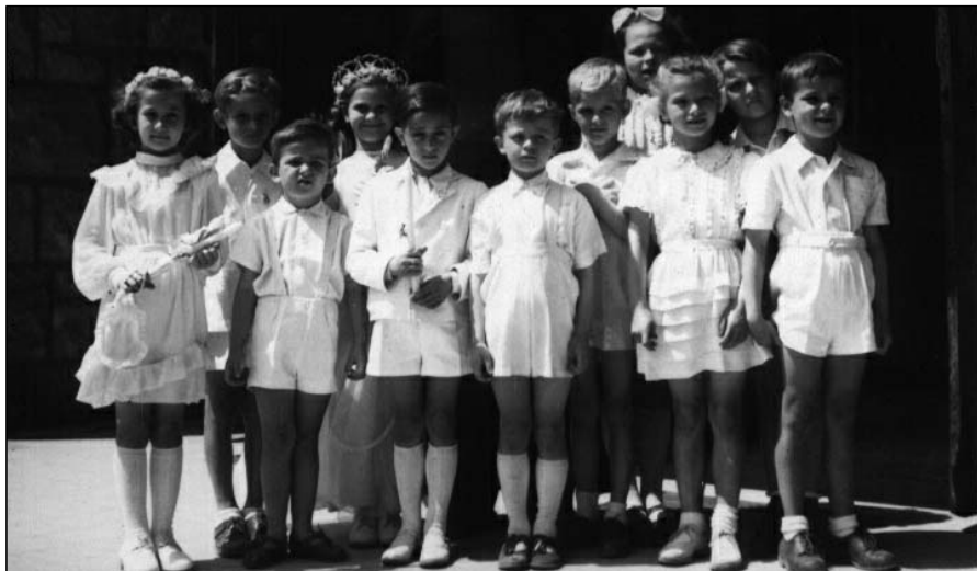
Az 1951-es elsőáldozók egy csoportja