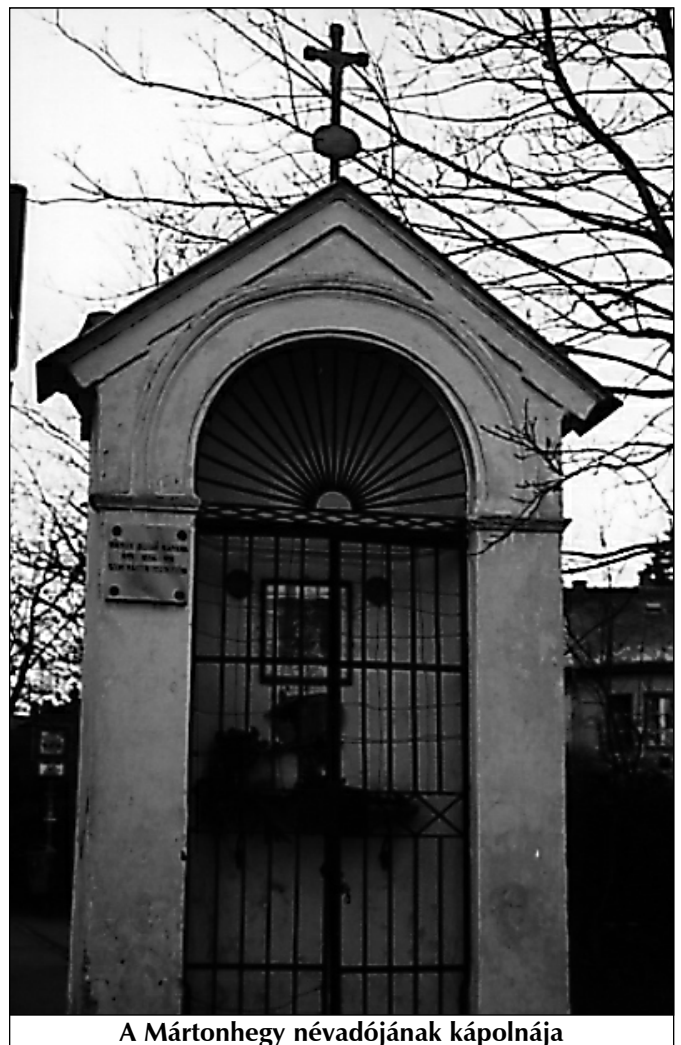
A Mártonhegy névadójának kápolnája