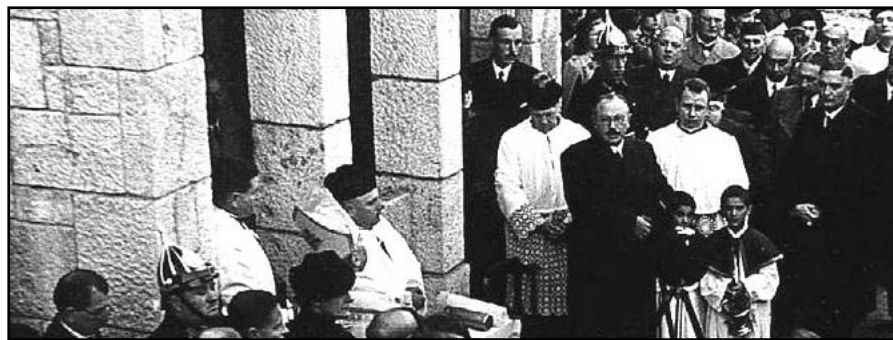
A plébániaépület megáldása (1939.)

1984-ben a templom felszentelésének 50. évfordulójáról helytörténeti kiállítással emlékeztünk meg. Most is szeretnénk ezt tenni. Kérjük, hogy akinek birtokában van régi fénykép vagy egyéb emléktárgy - a közelebbi és távolabbi múltból egyaránt - bocsássa rendelkezé-