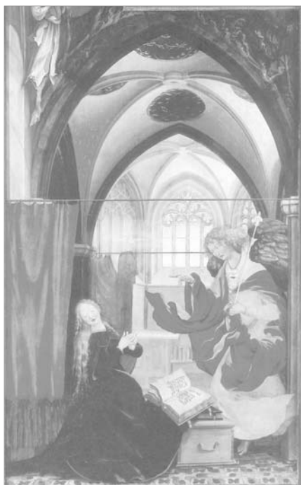
Matthias Grünewald: Angyali üdvözlés – részlet az insenheimi oltárról

Válaszoljunk Isten nekünk szegezett kérdésére! Álljunk Isten mellé, lépjünk az új lehetőségek útjára, hogy az új egyházi évben megújultan, megtisztultan éljünk!