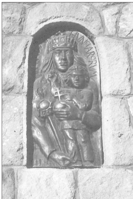
„Magna Domina Hungarorum” olvasható a nunciatúra Gyimes utcai kapujánál.

A Felső-Krisztinavárosi Plébánia területén számos nagykövetség található. Egyházi szempontból természetesen az a legérdekesebb, hogy az Apostoli Nunciatúra, vagyis a Szentszék diplomáciai képviselése néhány percnyi sétára van a templomtól. Aránylag köztudott, hogy milyen munka folyik egy nagykövetségen, de sokan nincsenek tisztában azzal, mi is a nunciatúra feladata.