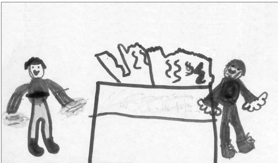
Farkas Benedek kishittanos rajza, amelyet a hittanos agapé ihletett